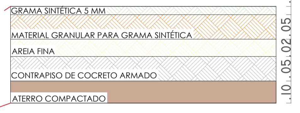
CORTE ESQUEMÁTICO CAMPO ESCALA: SEM ESCALA